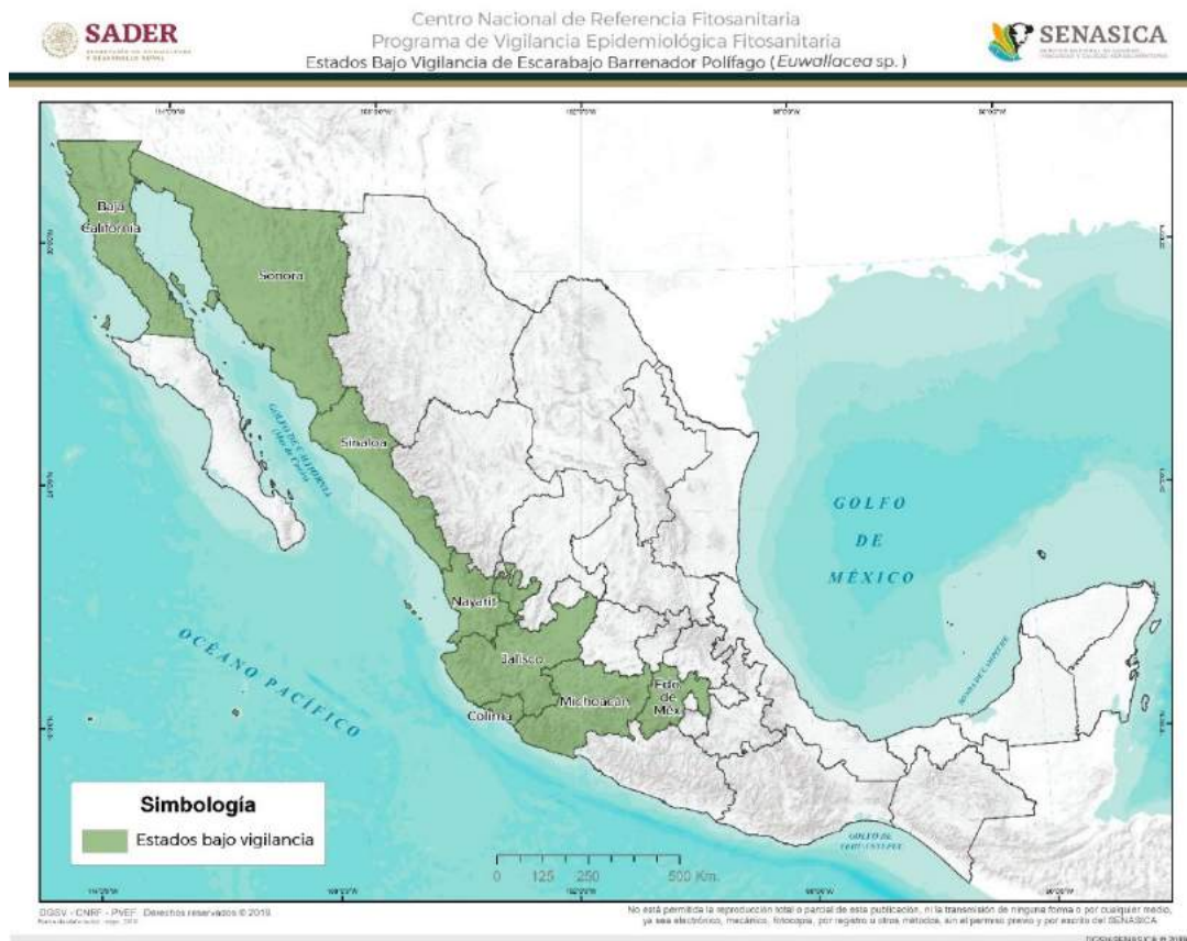
Figura 2. Vigilancia Epidemiológica Fitosanitaria para Euwallacea sp. en México Elaboración propia con datos de SADER-SENASICA-PVEF, 2019b.

En el presente año, las acciones para la vigilancia de Euwallacea sp. incluye las estrategias de área de exploración, exploración puntual, rutas de vigilancia y rutas de trampeo, implementadas en los estados de Baja California, Colima, Jalisco, Estado de México, Michoacán, Nayarit, Sinaloa, Sonora, (Figura 2) (SADER-SENASICA-PVEF, 2019b) en huertos comerciales de aguacate y zonas identificadas como de mayor riesgo, así como la revisión periódica de plantas centinela en puntos de ingreso del territorio nacional (SADER-SENASICA-PVEF, 2019b).